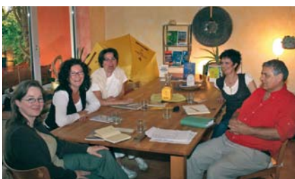
Teamworking und Erfahrungsaustausch