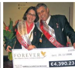
Eine Frau auf ihrem Weg nach oben