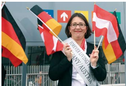
Begeisterung für das Geschäft