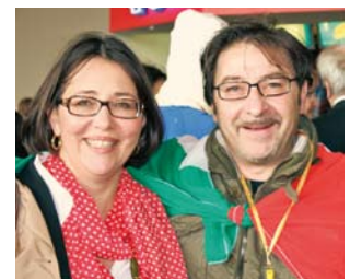
... in Italien eng verbunden