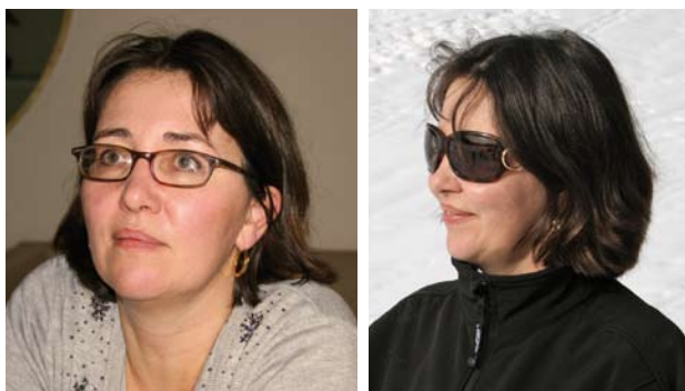
Persönliche Bereicherung durch FOREVER